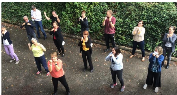
A la DSDEN de l'Ain