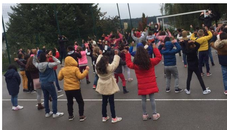
A l'école Louis Armand à Oyonnax